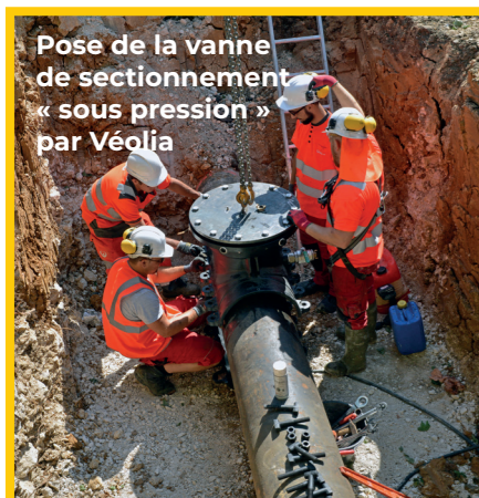
Pose de la vanne de sectionnement « sous pression » par Véolia