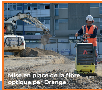
Mise en place de la fibre optique par Orange