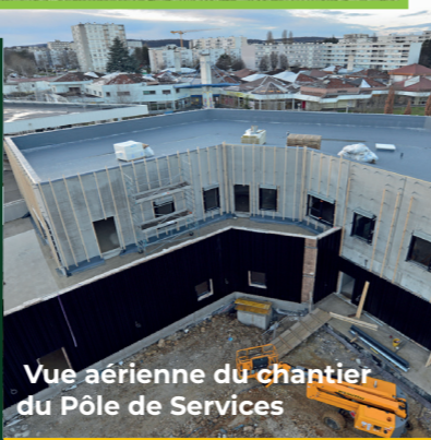
Vue aérienne du chantier du Pôle de Services