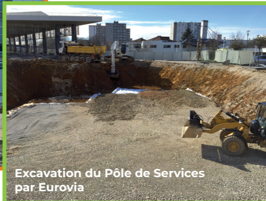
Excavation du Pôle de Services par Eurovia