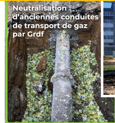
Neutralisation d'anciennes conduites de transport de gaz par Grdf